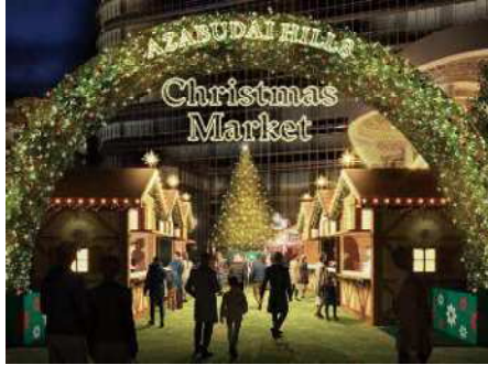
クリスマスマーケット