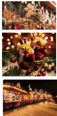
クリスマスカラー光の演出